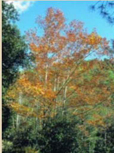
ΠΛΑΤΑΝΟΣ Platanus orientalis

Το μονοπάτι έχει μήκος 3 Km περίπου και για να το περπατήσει κανείς χρειάζεται 1-2 ώρες. Αρχίζει από σημείο του Κρουού Ποταμού κοντά στη θερινή προεδρική κατοικία Τροόδους, με υψόμετρο 1.600 m, ακολουθεί τις όχθες του ρυακιού με συνεχείς διασταυρώσεις σε όλη την πορεία του, περνά από το γνωστό για την ξεχωριστή ομορφιά του καταρράκτη των Καληδονιών και καταλήγει στο “Ψηλόν Δεντρό” κοντά στις Πλάτρες, με υψόμετρο 1.200 m. Ο Κρουός Ποταμός είναι ένα από τα λίγα ρυάκια στην Κύπρο με μόνιμα τρεχούμενο νερό, που χρησιμοποιείται, μεταξύ άλλων, και για ύδρευση του Τροόδους. Σ’ αυτή τη δροσερή και γραφική ρεματιά βρίσκεται το μονοπάτι μελέτης της φύσης.