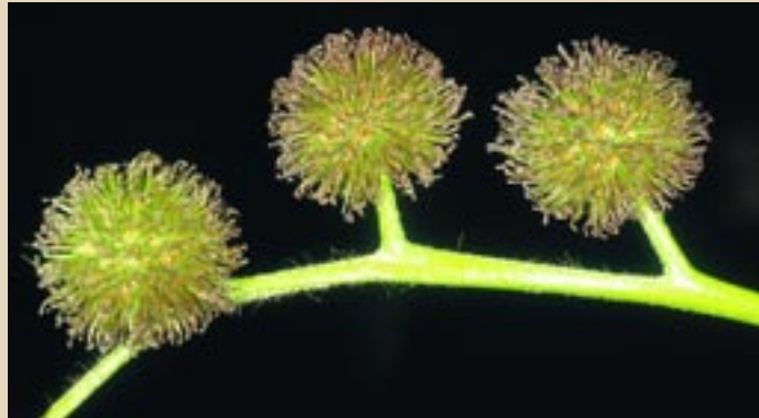
ΠΛΑΤΑΝΟΣ Platanus orientalis