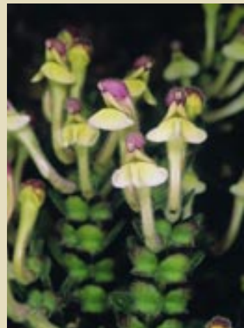
Scutellaria cypria var. cypria

8. ΤΥΠΙΚΗ ΕΜΦΑΝΙΣΗ ΔΟΥΝΙΤΗ με πορτοκαλί-καφέ χρώμα.