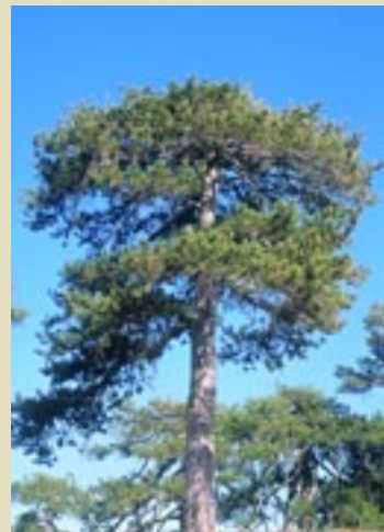
Pinus nigra ssp. pallasiana

9. ΠΑΡΒΑΡΕΤΣΙΑ Berberis cretica . Εμφανίζεται σε αλληλοεξάρτηση με τη Μαύρη πεύκη.