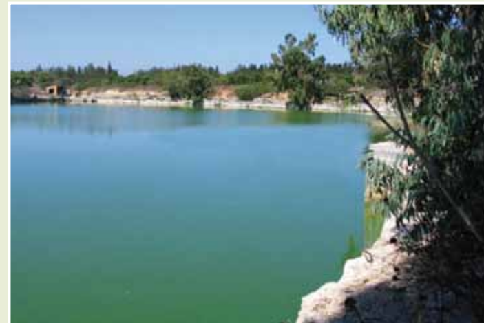
Δεσποτική λίμνη

Η Δεσποτική Λίμνη είναι ένας υγροβιότοπος Διεθνούς Σημασίας ο οποίος βρίσκεται στην Χερσόνησο του Ακρωτηρίου, στο Αγκρόκτημα του Αγίου Νικολάου. Παρά το γεγονός ότι είναι μια τεχνητή λίμνη, αποτελεί ένα υψηλής οικολογικής αξίας ενδιαιτήμα, καθώς εξυπηρετεί τις ανάγκες χιλιάδες μεταναστευτικών πουλιών ως η νοτιότερη υδατοσυλλογή γλυκού νερού στην Κύπρο.