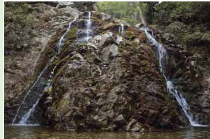
Καταρράκτης Χαντάρας Καταρράκτης της Χαντάρας, Φοινί

Ο καταρράκτης της Χαντάρας βρίσκεται στην κοίτη του ποταμού Διάριζου, βόρεια του χωριού Φοινί. Το ειδυλλιακό τοπίο που προσφέρει αποτελείται από σκλήδρους, πλατάνια, πεύκα, λατζιές, καθώς και πολλούς άλλους θάμνους και ποώδη φυτά. Ο επισκέπτης θα μαγευτεί από τις μυρωδιές του λάδανου, της φασκομπλιάς και της λεβάντας.