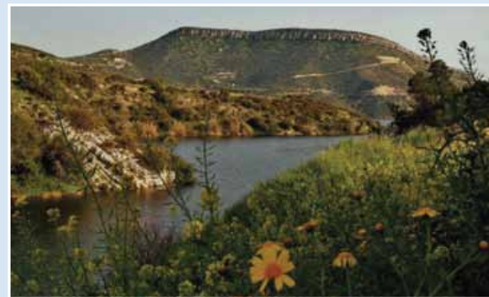
Υδατοφράκτης Γερμασόγειας, Akrounta in spring

Το φράγμα Αρμίνου βρίσκεται 40 km βόρεια της πόλης Πάφου, στον ποταμό Διάριζο, κοντά στο χωριό Αρμίνου. Δημιουργήθηκε το 1998 και η λίμνη του φράγματος στο υψόμετρο 436m, που είναι και η υπερκείλιση, έχει επιφάνεια 35.3 εκτάρια ενώ η λεκάνη απορροής του είναι 116.5 km 2 . Ο υδατοφράκτης Γερμασόγειας απέχει 8 km από την πόλη της Λεμεσού και εμπλουτίζεται με νερό από τον ποταμό Άμαθο. Αποτελεί ένα υδρόβιο περιβάλλον με πλούσια χλωρίδα και προσωρινή κατοικία πολλών υδρόβιων πουλιών. Κατασκευάστηκε το 1968 και η λεκάνη αποταμίευσης νερού έχει έκταση 110 εκταρίων.