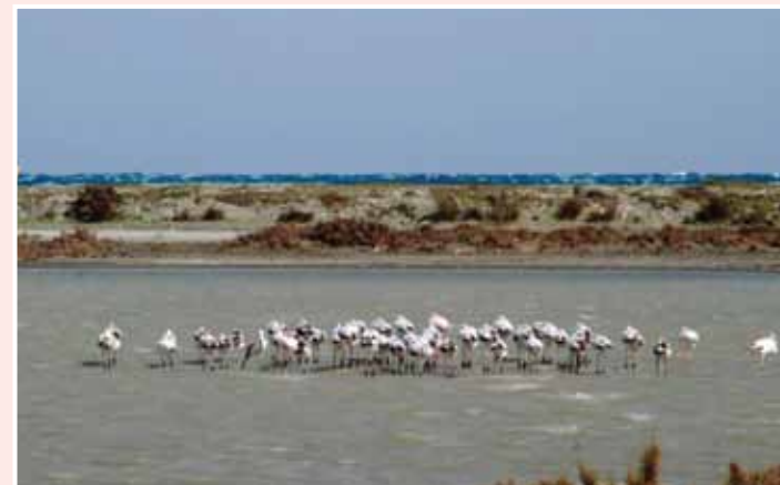
Αλυκή Ακρωτηρίου

Η Αλυκή Ακρωτηρίου, η μεγαλύτερη αλυκή του νησιού, βρίσκεται στο κέντρο της ομώνυμης χερσονήσου και έχει έκταση 940 περίπου εκτάρια. Το βάθος της φθάνει μέχρι και τα 2,7m κάτω από το επίπεδο της επιφάνειας της θάλασσας, με συγκέντρωση νερού περίπου στο 1m βάθος.