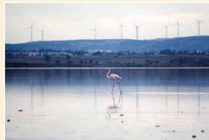
Αλυκή Λάρνακας Flamingo in the salt lake Larnaca

Η αλυκή Λάρνακας βρίσκεται στα νοτιοδυτικά της ομώνυμης πόλης. Θεωρείται ως Υγρότοπος Διεθνούς Σημασίας, ο οποίος προστατεύεται από τη Σύμβαση Ραμσάρ από το 2001, και ως Ζώνη Ειδικής Προστασίας από το 2005. Αποτελείται από ένα σύμπλεγμα 4 λιμνών διαφόρων μεγεθών. Είναι έκτασης 2,2 km 2 και φιλοξενεί μια σημαντική κλωρίδα και πανίδα που δημιουργούν ένα μαγευτικό τοπίο.