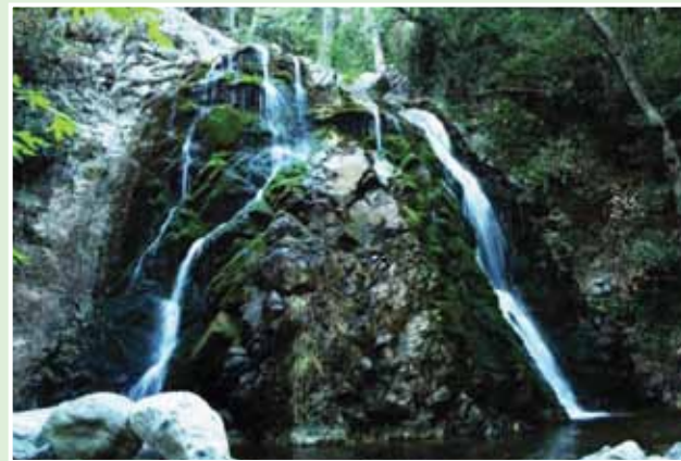
Καταρράκτης Χαντάρας © Αϊπαυλίτης Σοφοκλής, Χαντάρα

Η λίμνη του Αλμυρολίβαδου βρίσκεται κοντά στα μεταλλεία σε μια δύσβατη περιοχή της οροσειράς του Τροόδους. Οι επισκέπτες της θα πρέπει να διασχίσουν το γραμμικό