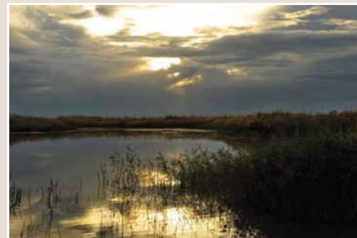
Λίμνη «Μακριά» © Παναγή Αλίκη AFIAP, Ladys mile Wetland

Η λίμνη «Μακριά» είναι μια φυσική, βαλτώδης, υφάλμυρη λίμνη, η οποία βρίσκεται κοντά από το χωριό Ζακάκι και την παραλία Απλώστρα (πρώην Lady's Mile). Προστατεύεται από τη Σύμβαση Ραμσάρ και φιλοξενεί πολλά υδροφιλά είδη. Κυρίαρχα είδη είναι τα Phragmites australis και Tamarix tetragyna , το οποία αποτελούν κατάλληλο ενδιαίτημα για τα είδη ορνιθοπανίδας της Λίμνης Μακριά.