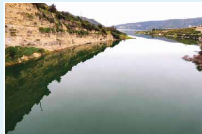
Υδατοφράκτης Κούρη © Παρασκευά Χρίστος, Υδατοφράκτης Κούρη

Το φράγμα του Κούρη αποτελεί τον μεγαλύτερο υδατοφράκτη της Κύπρου με χωρητικότητα 115 εκατομ. m3 νερού, ποσότητα η οποία αποτελεί το 35% της ολικής χωρητικότητας των φραγμάτων του νησιού. Τα ύδατά του αξιοποιούνται κυρίως για σκοπούς άρδευσης της επαρχίας και υδροδότησης της πόλης Λεμεσού.