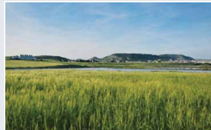
Λίμνη Ορόκλινης © Ζαχαρίου Γιάννος, Oroklini Lake

Η λίμνη της Ορόκλινης βρίσκεται νοτιοανατολικά του ομώνυμου χωριού και έχει συνολική επιφάνεια περίπου 1 km 2 . Εντοπίζεται στην καρδιά μιας περιοχής συνολικής έκτασης 93 εκταρίων, η οποία χαρακτηρίζεται από μεσογειακά αλμυρά λιβάδια με αλοφυτική βλάστηση, καλαμιώνες, θαμνώνες, παρόχθια βλάστηση και ποικιλόμορφα υδάτινα σώματα, τα οποία σχηματίζονται από εποχιακές βροχοπτώσεις και φιλοξενούν πλούσια πτηνοπανίδα.