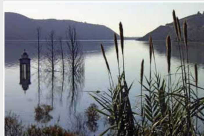
Υδατοφράκτης Κούρη, Φράκτης της Άλασσας

Το φράγμα του Κούρη αποθηκεύει νερό από τρεις κύριους ποταμούς, τον ομώνυμο ποταμό Κούρη, τον Λιμνάπη και τον Κρυό. Εμπλουτίζεται, επίσης, από εκτροπή του ποταμού Διάριζου. Στα νερά του φράγματος βυθίστηκε παλαιότερα η εκκλησία του Αγίου Νικολάου και το χωριό Άλασσα, το οποίο μεταφέρθηκε σε νέα τοποθεσία ψηλότερα από το φράγμα.