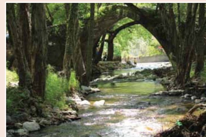
Ποταμός Διάριζος © Χριστοδούλου Κατερίνα, Ο ποταμός του Διαρίζου

Ο ποταμός Διάριζος είναι ο 4ος μεγαλύτερος σε μήκος ποταμός της Κύπρου, ο οποίος πηγάζει από την οροσειρά του Τροόδους και εκβάλλει κοντά στο χωριό Κούκλια. Αποτελεί ένα από τα ελάχιστα ποτάμια του νησιού που ρέει ολόχρονα και περνά μέσα από φυσικά μονοπάτια, καταρράχτες, τα γιοφύρια του «Τζιελεφού» και της «Ελιάς», το φράγμα της Αρμίνου και το δάσος της Πάφου.