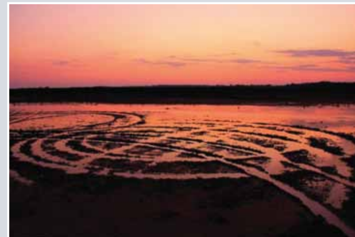
Αλυκή Ακρωτηρίου © Σάββα Τάσος ΑΓΙΑΡ, Μουσικό κλειδί

Η Αλυκή Ακρωτηρίου αποτελεί μια περιοχή σημαντικής περιβαλλοντικής σημασίας και έχει κηρυχθεί, το Μάρτιο του 2003, ως Υγρότοπος Διεθνούς Σημασίας στα πλαίσια της Σύμβασης Ραμσάρ. Είναι διεθνώς γνωστή για τη σημαντική ποικιλία και το μεγάλο αριθμό πτηνών, τα οποία είτε ζουν μόνιμα, είτε ξεχειμωνιάζουν, ή απλώς διέρχονται κατά τη φθινοπωρινή και ανοιξιάτικη μετανάστευσή τους.