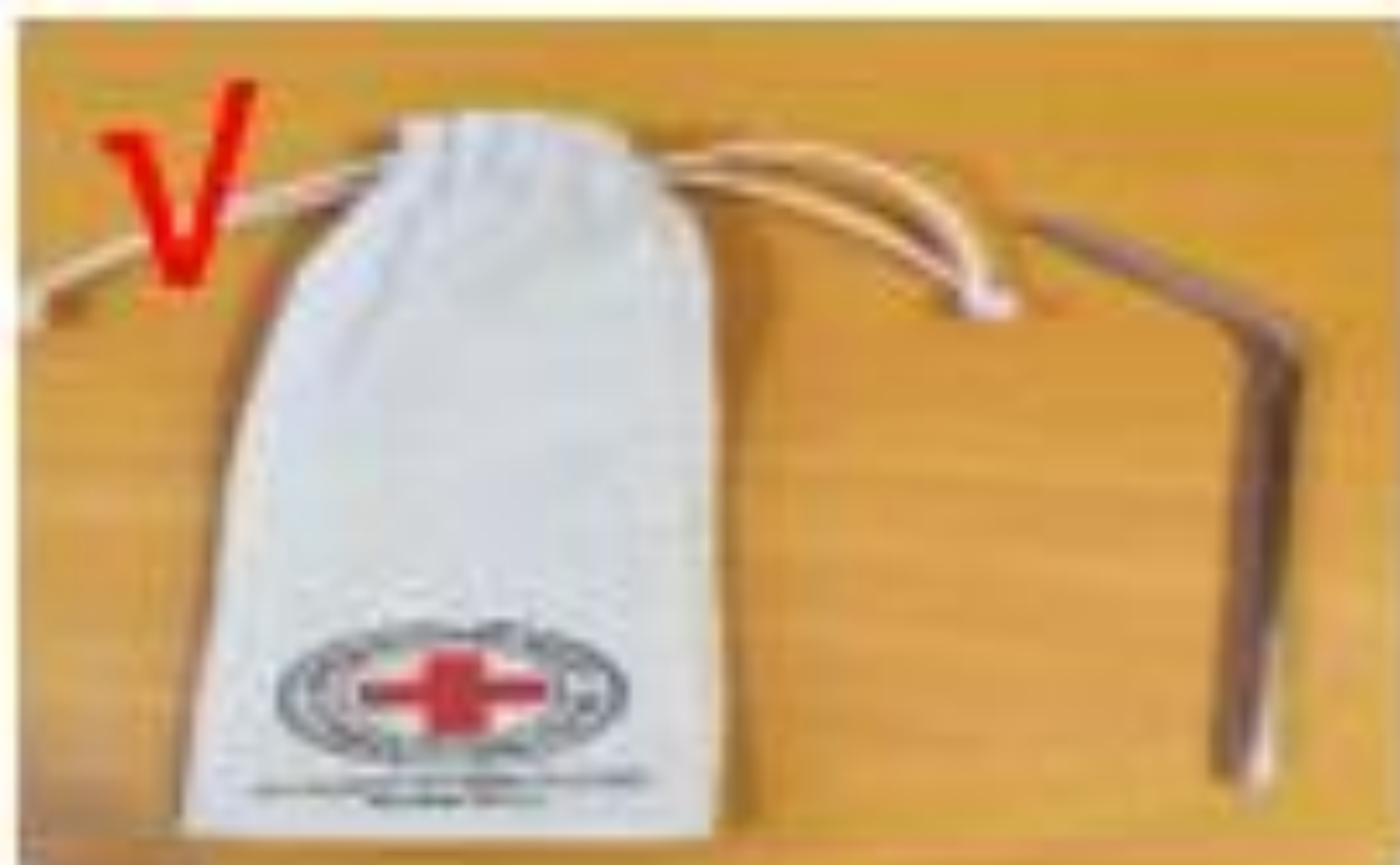
Εικόνα 7 & 8