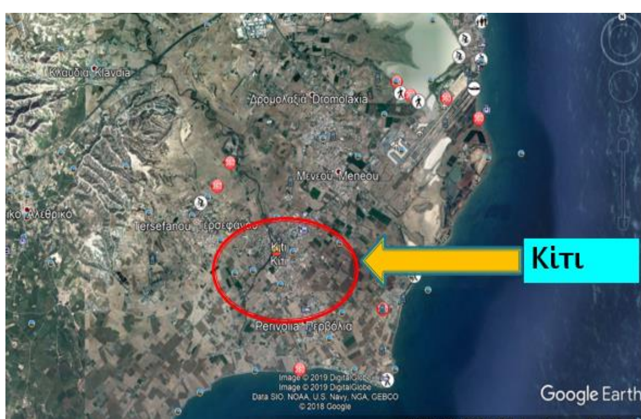
Δορυφορική εικόνα (Περιοχή Κιτίου)

Οι συνεντεύξεις έγιναν στην υπεραγορά «Κούρος» στην Δροσιά και στον φούρνο «Ηλιοτρόπιο» στην Ορμήδεια. Σύμφωνα με τα αποτελέσματα των συνεντεύξεων στους τριάντα πελάτες μόνο οι δέκα πλέον αγοράζουν πλαστική σακούλα. Οι περισσότεροι αποδέχτηκαν την νέα νομοθεσία και παίρνουν την δική τους αυθεντική σακούλα ή κουβαλούν τα προϊόντα τους στο χέρι (αν είναι μόνο ψωμί ή γάλα). Δύο υπαλλήλοι της υπεραγοράς «Άλφα Μέγα» δήλωσαν ότι αυτή η νομοθεσία έπρεπε να εφαρμοστεί από καιρό και ότι οι καταναλωτές έχουν μειώσει κατά 80% περίπου την χρήση της πλαστικής σακούλας.