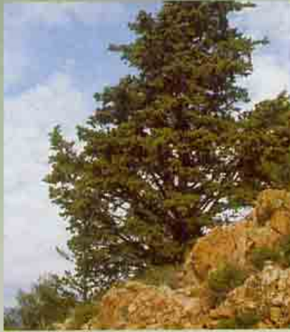
Κυπάρισσος η αιθαλής