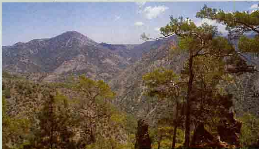
Δάσος Πεύκης Τραχείας (Μαύροι κρεμμοί - Κύκκος)

Σήμερα τα δάση και οι δασικές εκτάσεις περιορίζονται κυρίως στα βουνά του Τροόδους και του Πενταδακτύλου. Μικρότερες δασικές εκτάσεις βρίσκονται είτε στους πρόποδες των δυο οροσειρών είτε σε πεδινές και ημιορεινές περιοχές. Έχουν έκταση 1.754, 319 km 2 (η έκταση της Κύπρου είναι 9.254,480 km 2 ). Σε γενικές γραμμές, μπορούμε να τα διακρίνουμε σε τέσσερις κατηγορίες: α) φυσικά πευκοδάση, β) αναδάσωσης / δασώσεις κυρίως με πεύκη τραχεία, γ) ψηλούς και χαμηλούς θαμνώνες, φρύγανα και λιβαδικές διαπλάσεις, και δ) γυμνές εκτάσεις - φράχτες, μεταλλεία κτλ. Για σκοπούς διαχείρισης χωρίζονται σε δυο μεγάλες κατηγορίες: τα κύρια και τα δευτερεύοντα δάση.