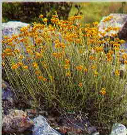
Ηλίχρυσον το σφαιρικό

Περιορίζεται στην οροσειρά του Πενταδακτύλου σε υψόμ. από 300 μέχρι 800 m.