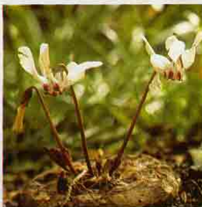
Κυκλάμιον το κύπριον