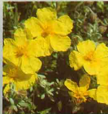
Ηλιάνθεμον το αμβλύφυλλον