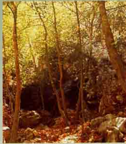
Πλάτανος η ανατολική

δασών της Κύπρου και σχηματίζει εκτεταμένα δάση τόσο στην οροσειρά του Τροόδους όσο και στην οροσειρά του Πενταδακτύλου, αλλά και σε άλλες περιοχές.