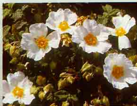
Κίστος ο φασκομηλόφυλλος

Είναι κοινό είδος και διακρίνεται στα υποείδη fasselata (υψόμ. μέχρι 1.000 m.) και crudelis (υψόμ. 1.100 μέχρι 1.950 m.)