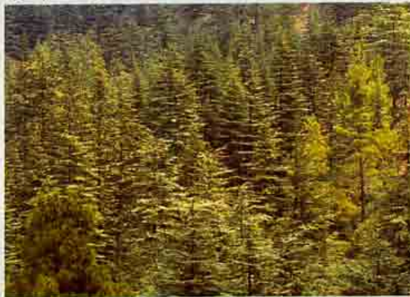
Κέδρος η βραχύφυλλη

Περιορίζεται στην ευρύτερη περιοχή του Τριπύλου (Δάσος Πάφου) σε υψόμ. από 800 μέχρι 1.360 m. Είναι το μοναδικό ενδημικό δέντρο της Κύπρου και περιλαμβάνεται σε δυο διεθνείς καταλόγους σπάνιων και απειλούμενων φυτών: τον κατάλογο