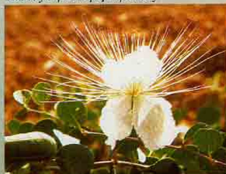
Κάππαρις η ακανθώδης