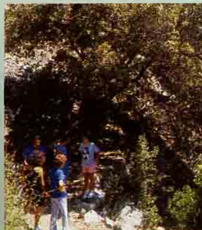
Δρυς η κληθρόφυλλη