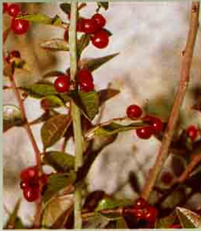
Μποζέα η κυπρία