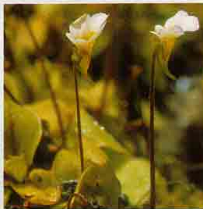
Πιγκουικούλα η κρυστάλλινη

Πολυετές το οποίο απαντά σε υγρότοπους σε υψόμ. μέχρι 1.600 m.