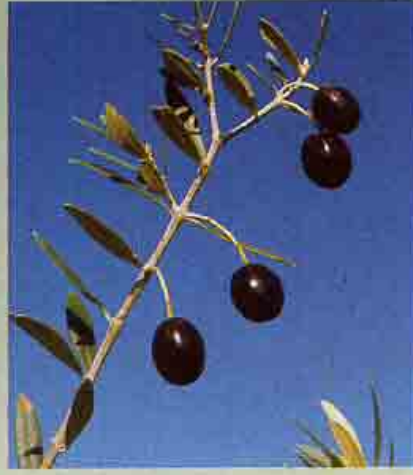
Ελιά η ευρωπαϊκή