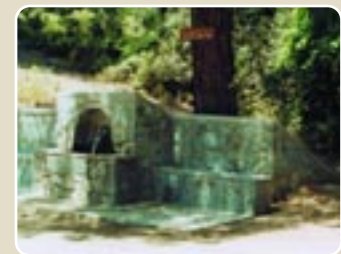
Βρύση του Πετρή

Ο υδρολογικός ρόλος του δάσους συνίσταται κυρίως στο φιλτράρισμα και καθάρισμα του νερού της βροχής και των χιονιών, στην αποθήκευση του στα υπόγεια